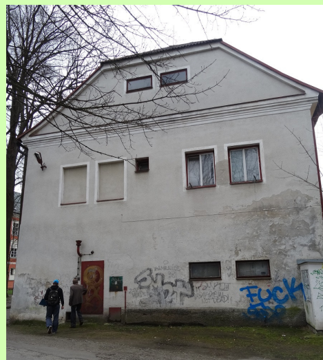
budova bývalého kina v Kamenici nad Lipou, v Národní databázi od r.2019

Podmínkou pro podání žádosti o dotaci bylo zaevidování objektu právě v národní databázi brownfieldů u agentury Czech Invest. U všech tří objektů se zaevidování zdařilo.