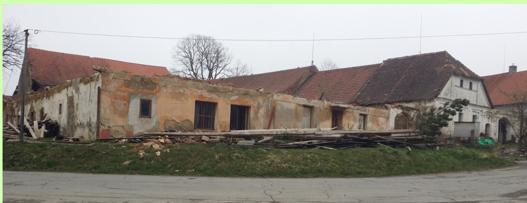
bývalá zemědělská usedlost, obec Leskovice, zapsáno do Národní databáze v r.2019

V Kamenici a Černovicích je žádost podána na rekonstrukci objektu, zatímco v Leskovicích bude objekt nejpve odstraněn a na jeho místě vyroste nová budova.