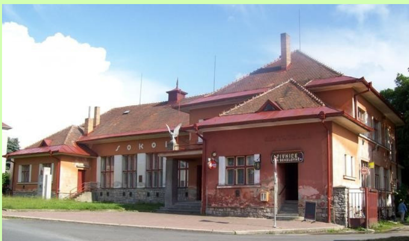
bývalá sokolovna, město Černovice, v Národní databázi od r.2019

Pracovníci DSO Nová Lípa podali žádost o dotaci v dotačním titulu Ministerstva pro místní rozvoj na podporu regenerace brownfieldů pro nepodnikatelské využití pro tři členské obce svazku. Jedná se o budovu bývalého kina v Kamenici nad Lipou, budovu bývalé sokolovny v Černovicích a budovu bývalé zemědělské usedlosti v Leskovicích. Nyní čekáme na jejich vyhodnocení.