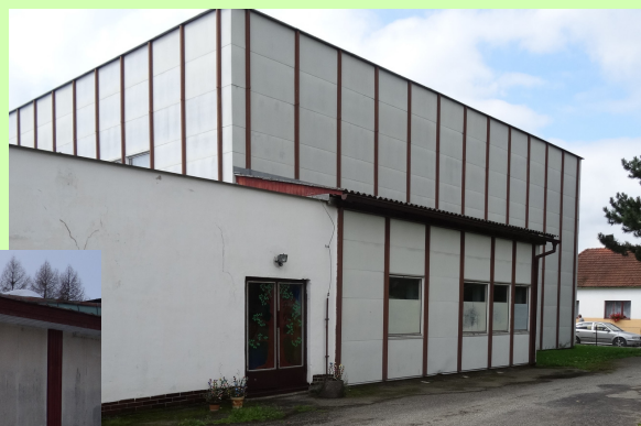
objekt bývalých učeben ZŠ Nová Cerekev, krytina z azbestu

Existence brownfieldů v území má na okolí negativní dopad. Mimo vlastní degradace prostředí sem patří i nebezpečí ze špatného stavebně-technického stavu (odpadávání jednotlivých částí staveb, propady, zřícení...), negativními sociálně demografické jevy (zvýšená nezaměstnanost, kriminalita...) a snížení ekonomického potenciálu okolí (snížení cen nemovitostí, přesun podnikatelských aktivit mimo blízké okolí brownfieldu...).